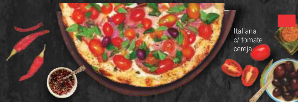
Italiana c/ tomate cereja